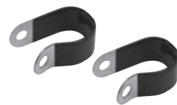
シートステー取付用クランプ 2個 ※ カーボン製フレームには使用できません。