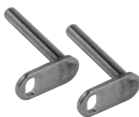
カンチブレーキ台座 取付ブラケット 2本