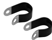
シートステー取付用クランプ 2個 ※ カーボン製フレームには使用できません。